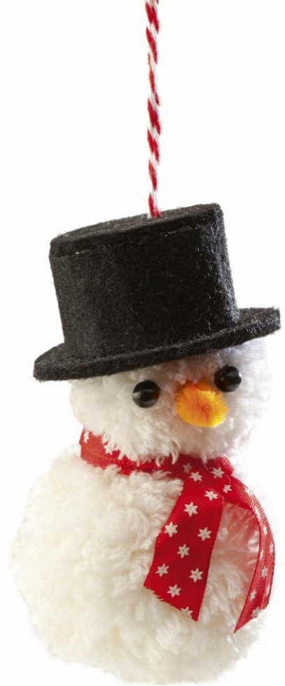
Nikolaus, Elch, Schneemann – mit Pompons lassen sich viele verschiedene Weihnachtsbaumanhänger gestalten.